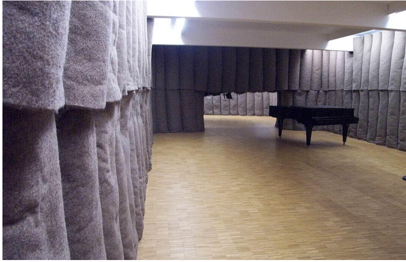
شكل (٨) جوزيف بويس - المحنة

في المتحف القومي للفن الحديث بمركز جورج بومبيدو تم تجهيز مكان (غرفة) لعرض العمل الفني المحنة Plight للفنان جوزيف بوس Joseph Beuys شكل (٥) والمعروض ضمن المعرض الدائم ليعطي الإحساس والشعور للزائر بالتناقض بين الدفء والعزلة الذي قصده الفنان، كذلك العمل الفني حديقة الشتاء Le Jardin d'hiver الفنان جان دوبوفيت Jean Dubuffet شكل (٦)