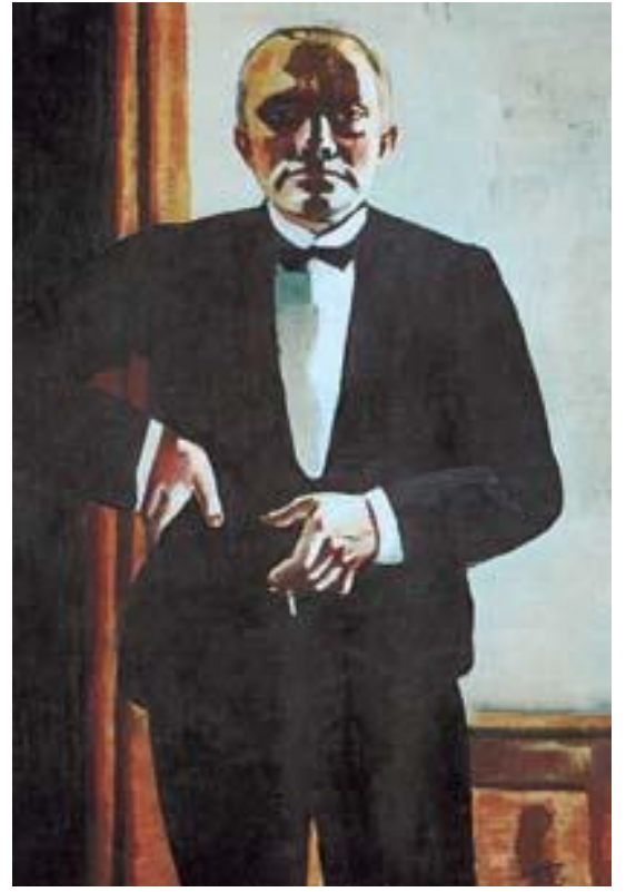
شكل (٦) ماكس بيكمان - صورة شخصية في بدلة رسمية عام ١٩٢٧- متحف بوش رايزينجو- جامعة هارفرد-ماساتشوسيتس

ان اعمال الفن الحديث والتي مازالت تواجه الغموض في الفهم والتفسير بالنسبة للجمهور العادي دائما في حاجة للإيجاد طرق عرض غير تقليدية، والا تعتمد فقط على الطرق السردية والتسلسل الزمنى والتي لن تؤدي الى الغاية المقصودة من العرض المتحفي. وانما يجب انتعتمد أكثر على البحث عن كيفية طرح المفاهيم لتحقق توقعات الزائر العادي، اما بالنسبة للأعمال الفنية