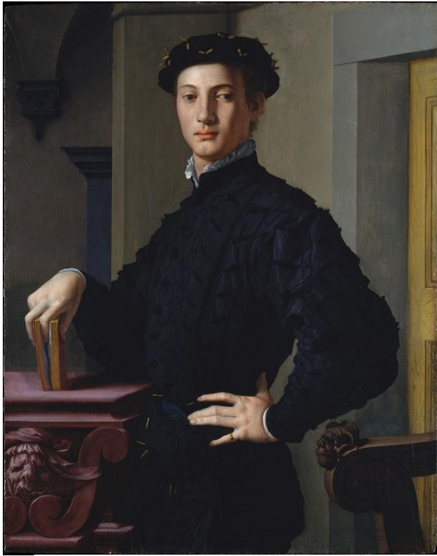
شكل (٧) انجلو برونزينو - صورة شخصية لشباب - حوالى عام ١٥٣٥- متحف العاصمة للفن - نيويورك- من مقتنيات هافماير - ورثة السيد هافماير ١٩٢٩

فان نطاق المواضيع الملاءمة يعتبر هائلا ١ فكل من العمل الفني لماكس بيكمان Max Beckmann شكل (٦) من المدرسة التعبيرية في الفن الحديث والعمل الفني ل أنجلو برونزينو Agnolo Bronzino شكل (٧) من عصر النهضة "فكلا العملين يستعملان الشكل Form لوصف مظهر الانسان وافكاره الداخلية، بالإضافة الى تحقيق الجمال والثقة بالنفس للشباب عند أنجلو نجد ان بيكمان الذي يواجه نفسه يصور رجلا اكبر سنا حيث يظهر كأنه رجل ذو خبرة وتعبير ساخر واللامبالاة في وضع اليدين يتكون لدينا انطباع مشؤوم قلق ٢ بالرغم من ان كل من العملين ينتمى من حيث المشابهة الى النوع نفسه وهو التعبير عن الانسان فيعبر ويكشف كل منهما عن طبيعة عصر مغايرة سواء في الأسلوب او القيم الجمالية او التقنية المستخدمة، هذا الأسلوب في حالة العرض المتحفي يستطيع ان يحفز القدرة عند الزائر على التفكير الناقد والقدرة على المقارنة للاكتشاف.