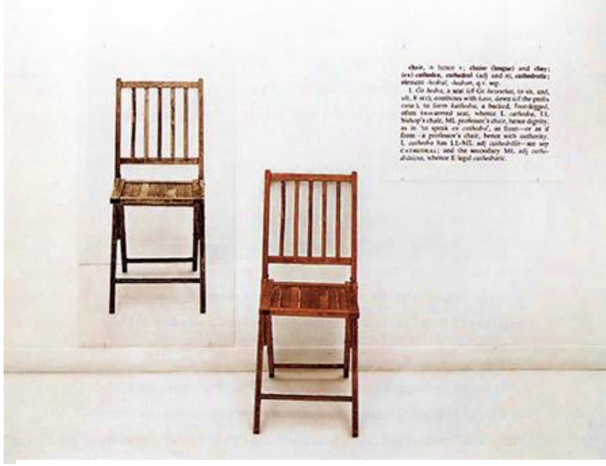
شكل (٤) جوزيف كوست – واحد وثلاث كراسي - ١٩٦٥

أيضا علم الجمال من العلوم الهامة التي تسهم في الكشف عن المعايير الجمالية للأعمال الفنية، فالمعايير الجمالية متغيرة وغير ثابتة، وعلى مدى امتداد عصور الفن نجد بعض لمعايير تسيطر على الاعمال الفنية، وبمعرفة علم الجمال نستطيع انتقاء الاعمال الفنية التي تكشف عن المعيار الجمالي مثل المثالية او الواقعية او المحاكاة عبر عصور الفن المختلفة وتكشف عن