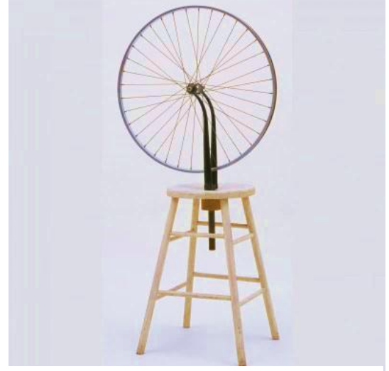
شكل (٣) مارسيل دوشامب – عجلة الدراجة -