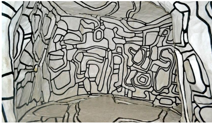
شكل (٩) جان دوبوفيت - حديقة الشتاء - المعرض الدائم - متحف القومي للفن الحديث - مركز جورج بومبيدو - ١٩٧٠

المعرض الدائم - متحف القومي للفن الحديث - مركز جورج بومبيدو - ١٩٨٥